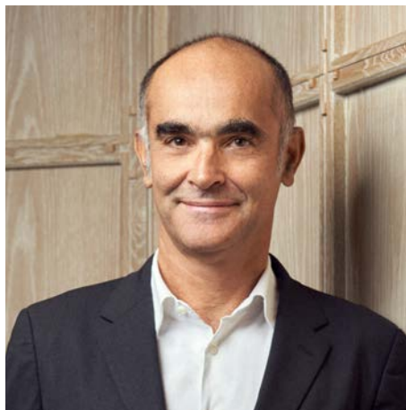
Gilles Andrier 최고경영자

우리는 사업을 하는 모든 곳에서 인권을 존중하는 데 전념합니다. 우리는 우리가 있는 지역 사회에 긍정적인 영향을 미치기 위해 노력하며 미래 세대를 위해 환경과 지구의 생물다양성을 보존하는 데 기여해야 할 중요한 의무가 있음을 인식합니다. 우리의 책임 있는 소싱 프로그램은 유엔 지속 가능한 개발 목표(부록 참조)를 지원합니다.